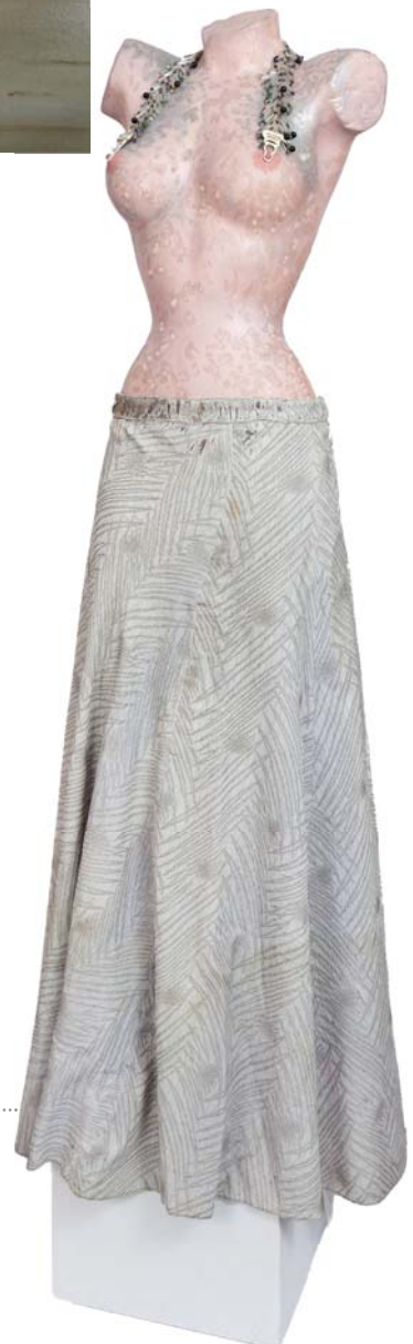
Мерет Оппенгейм (1913–1985). Манекен с поясом для подвязок, 1968 г. Манекен, юбка, стеклянные бусы, фрагменты стекла, масляная краска Meret Oppenheim (1913–1985), Abendkleid mit Büstenhalter-Collier , 1968. Buste de mannequin, jupe, collier de perles de verre, fragments de verre, peinture à l'huile, 145 x 41 x 28 cm

разумеется, не выставлен». В офисах не выставлен, зато был одолжен в прошлом году нью-йоркскому Метрополитен-музею, который был счастлив представить работу немецко-швейцарской художницы-сюрреалистки в рамках выставки «Как жизнь: скульптура, цвет и тело (с 1300 года до наших дней)». Вот лишь один пример того, как группа Пикте щедро делится своими сокровищами со швейцарскими и иностранными музеями, при этом свято следуя еще одному незыблемому правилу – ничего не продавать и никогда не спекулировать искусством.