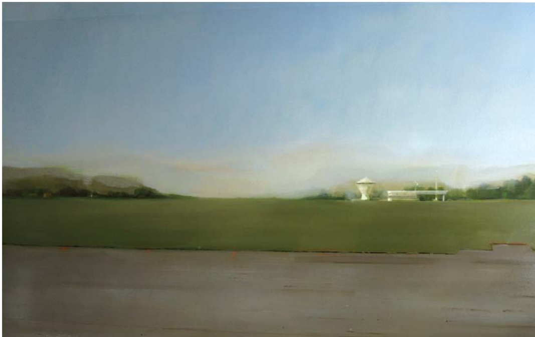
Кока Рамишвили (р. 1956). Назад в будущее: Аэродром №2, 2011 г. Масло, холст Этот родившийся в Тбилиси художник – единственный представитель постсоветского пространства в арт-коллекции Банка Пикте. Надеемся, только пока!