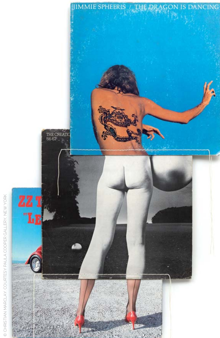
Кристиан Марклей (р. 1955). Сотворение (Тело), 1991 г. 3 чехла от дисков, нить Christian Marclay (1955). The Creation (Body Mix) , 1991. 3 pochettes de disque, fil, 70,2 x 43,8 cm

По каким причинам некоторые художники приезжали в Швейцарию – понятно, а вот почему другие покидали этот оазис мира и спокойствия?