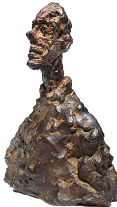
Альберто Джакометти (1901–1966) Бюст Диего, 1954 г. Бронза

И правда, о швейцарском происхождении некоторых знаменитых художников порой забывают. Кто вспомнит, например, что Арнольд Бёклин, чей «Остров мертвых», вдохновивший Сергея Рахманинова, находится в собрании Государственного Эрмитажа, родился в Базеле?