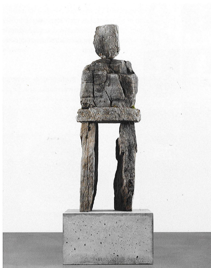
@ Stefan Altenburger, Rondinone, The Clear

Ce duo minéral fait partie d'un ensemble de 37 pièces collectivement intitulées «Soul», composant une foule expressive mais silencieuse, présenté à New York en 2013. L'exposition s'était vue assortie d'une installation temporaire de neuf géants de pierre sur le Rockefeller Plaza.